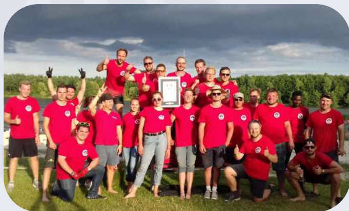
Die Teamgeist AG