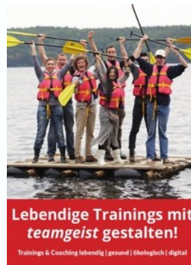
Katalog: Trainings & Coaching