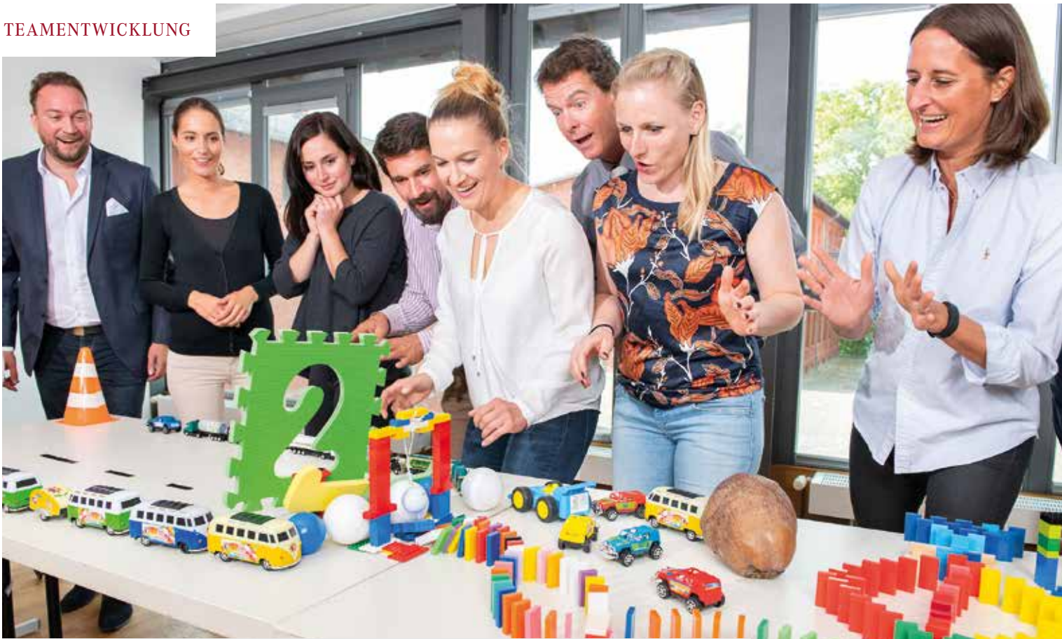
Team Events wie die Impulsreaktion (oben) stärken das Wir-Gefühl und die Kommunikation. Mit der digitalen Schnitzeljagd tabtour® (unten) können firmenspezifische Inhalte spielerisch vermittelt werden. Beide Eventformate eignen sich als innovative Rahmenprogramme für Tagungen.

B esonders in Zeiten des Fachkräftemangels und neuer Arbeitsmodelle werden Teambuildingmaßnahmen immer wichtiger. Und das in ganz unterschiedlichen Teamphasen und -konstellationen. Wenn zum Beispiel neue Teammitglieder an Bord Ihres Unternehmens kommen, gilt es, diese im Onboarding Prozess umfassend zu integrieren. Und das gelingt mithilfe von Team Events mit deutlich mehr Leichtigkeit. So bauen Sie direkt in der Startphase Vertrauen bei den neuen Kollegen, aber auch in bestehenden Teams auf. Denn Mitarbeitende, die sich wohlfühlen, werden zu langfristig motivierten Teammitgliedern. Doch auch Abteilungen, die bereits seit Jahren zusammenarbeiten, können durch Teambuildingmaßnahmen in ihrer Kommunikation und ihrem Zusammengehörigkeitsgefühl gezielt gestärkt werden. Dieser Wunsch nach „WIR-Gefühl“ macht sich bei teamgeist, dem deutschlandweit führenden Anbieter für Team Events, auch in den Buchungszahlen bemerkbar. Die Nachfragesituation ist größer denn je und weist besonders bei