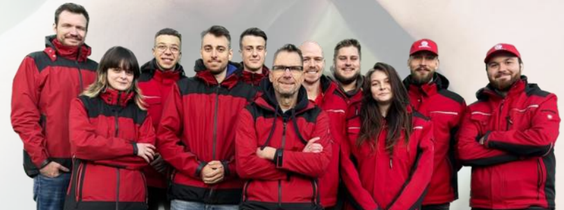
Team der Teamgeist West GmbH

Tel.: +49 201 486 494 70 E-Mail: nrw@teamgeist.com Web: www.teamgeist.com