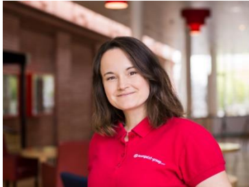
teamgeist-Eventexpertin Anna Kühl

Teams innerhalb eines begrenzten Zeitrahmens knifflige Rätsel lösen und ihre gemeinsame Strategie entwickeln, um das fiktive Szenario rund um die KI Tara zu bewältigen. Die Aufgaben sind so gestaltet, dass sie kreatives Denken und Kollaboration fördern und gleichzeitig verdeutlichen, wie wichtig innovative Lösungsansätze im Umgang mit globalen Herausforderungen sind. Tara bietet nicht nur die Möglichkeit, als Team zusammenzuarbeiten, sondern auch den Nervenkitzel eines Escape Games an der frischen Luft – eine mitreißende Kombination, die für ein nachhaltiges Gemeinschaftsgefühl und ein unvergessliches Weihnachtsfeier-Erlebnis sorgt.